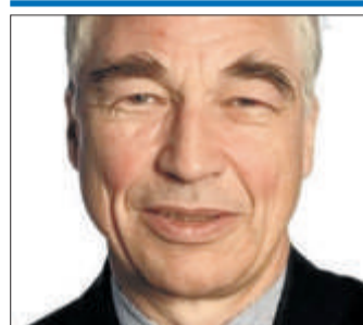
«Ich komme gerne in meine Heimatstadt zurück.»

► Die zwei Favoriten sagten aber ab. Nun geht die Suche nochmals von vorne los.